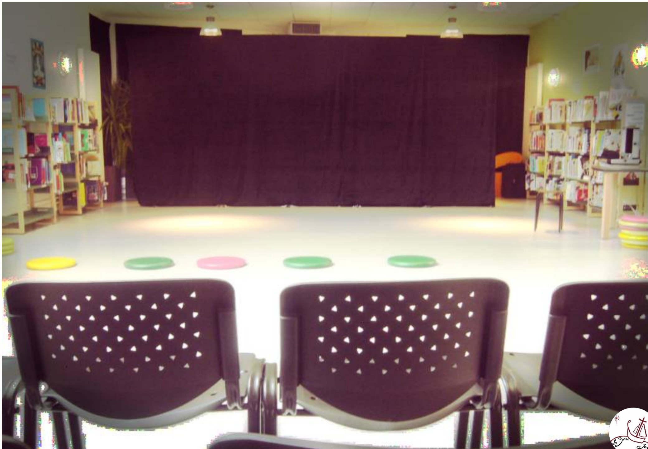
Scénographie version « lumière naturelle ».