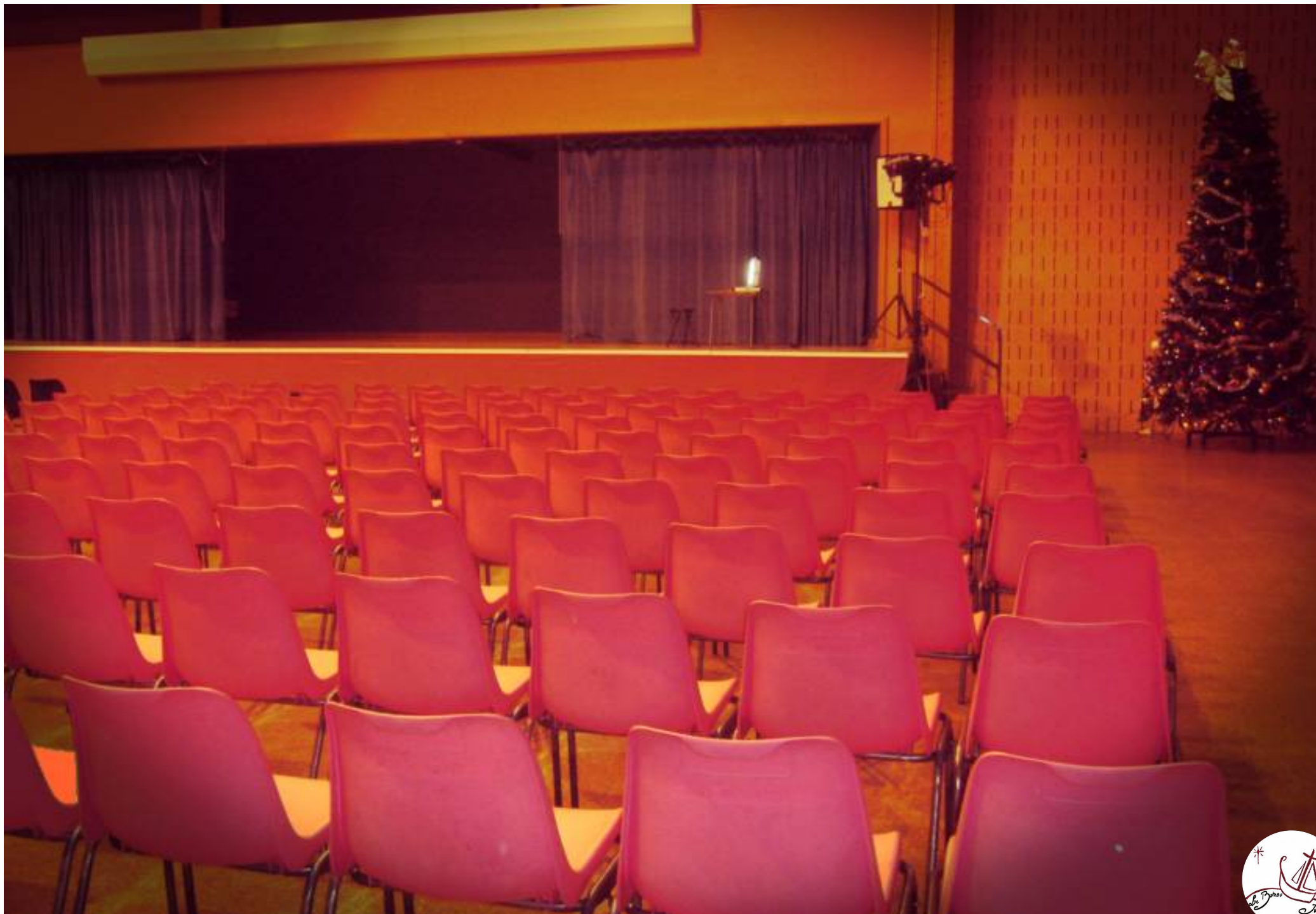
Une représentation de Mr Alone dans « Marche dans les nuages ».