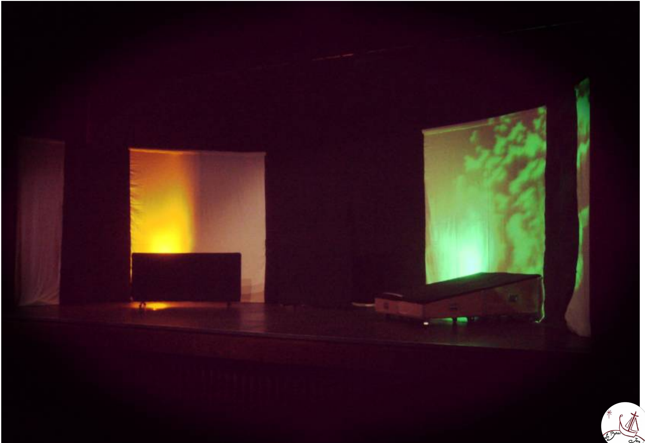
Scénographie version « éclairage électrique ».