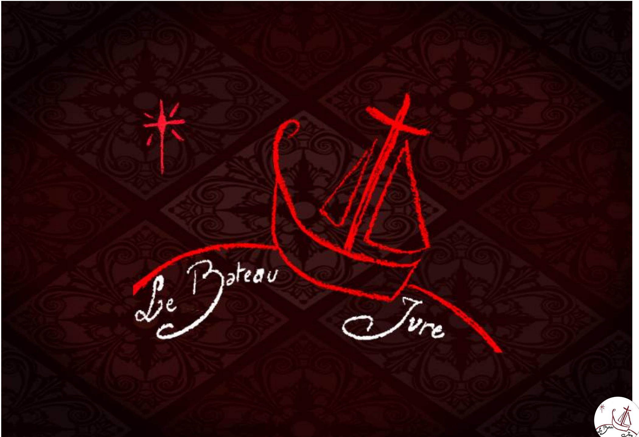
Logo : Anne-Marie Laussat | Logo de la compagnie « Le Bateau Ivre » créé en 2005.