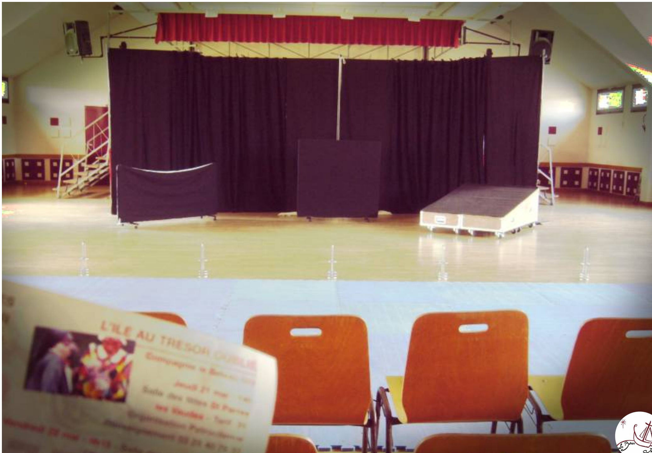
Scénographie version « lumière naturelle ».