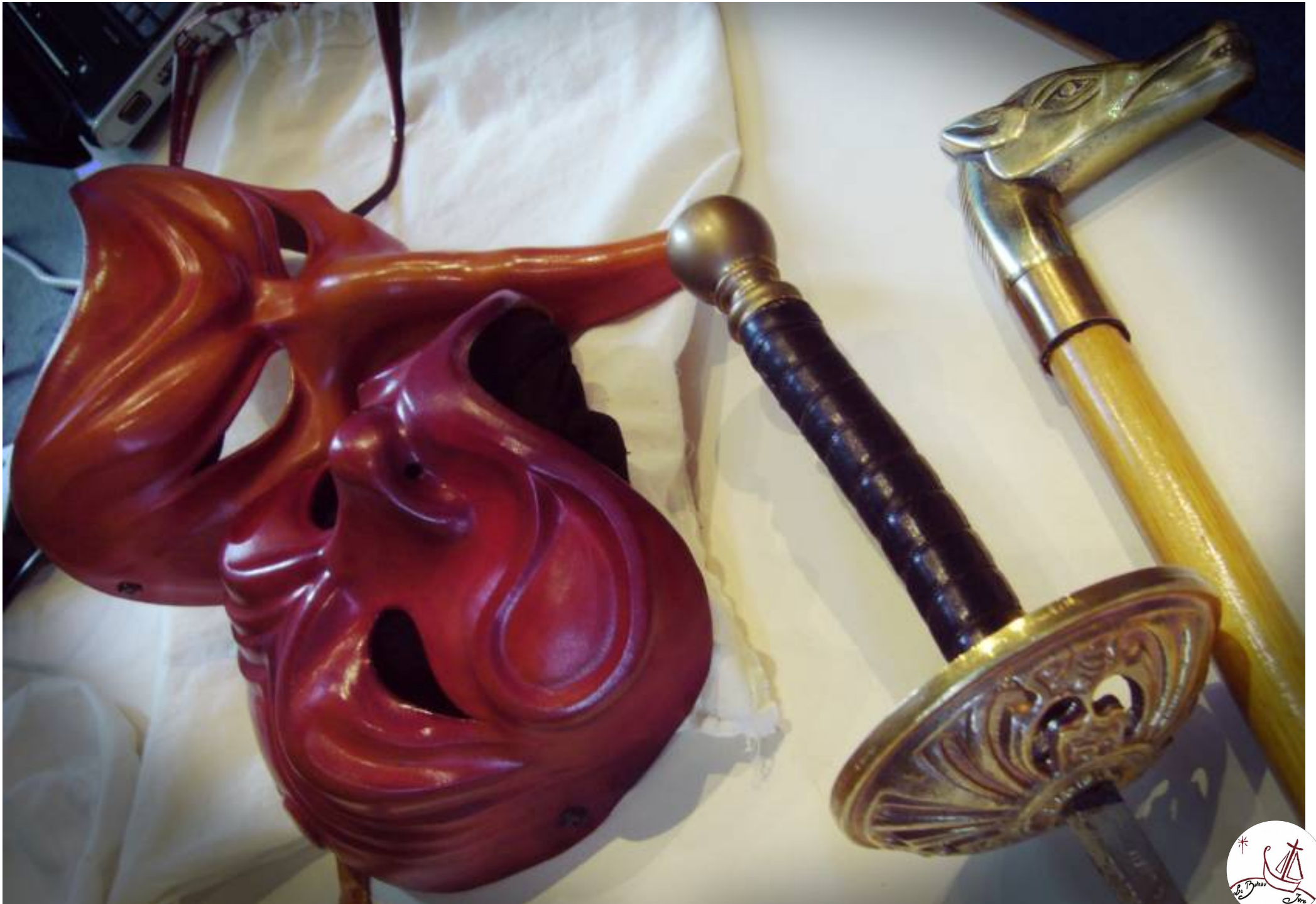
Masque de Capitan et d'Arlecchino, fleuret d'Arlecchino et canne de Pantalon.